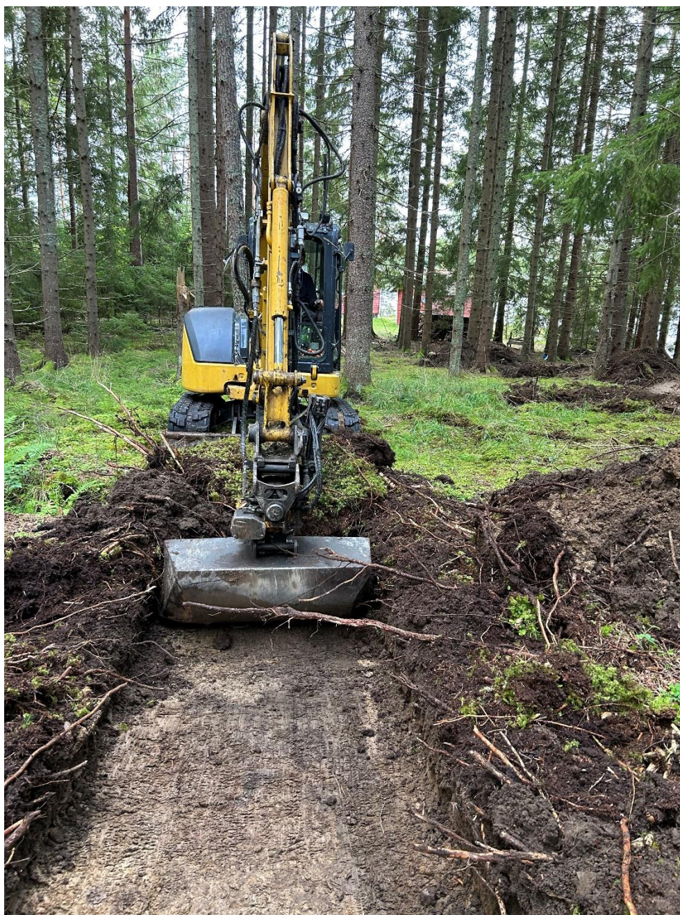
Figur 6. Schaktning av schakt 11. I bakgrunden syns sommarstuga nere vid sjön.

Schaktning genomfördes med en grävmaskin med en 1,3 meter bred skopa under överseende av två arkeologer. Schaktning koncentrerades till de områden som bedömdes inneha störst potential att innehålla sedan tidigare okända fornlämningar. Sammanlagt grävdes 15 sökschakt som varierade mellan 2–13 meter i längd. Majoriteten av schakten var mellan 1,3–1,4 meter breda och mellan 0,2–0,3 meter djupa.