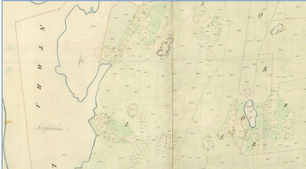
Figur 3. Utsnitt ur Laga skifteskarta från 1841. Vänster om L återfinns ovan nämnda torp. LMS akt: R78-13:6.

De äldsta spåren efter mänsklig bosättning i och omkring Trankils socken består av lösfynd av olika slags stenredskap samt ett stort antal platser som registrerats som boplatser. Flertalet av de senare kom att upptäckas och registreras under 1990-talet. Ett mycket litet antal av dessa boplatser har undersökts av arkeologer. Bland undantagen återfinns en boplatz på Hästholmen i Holmedal, L2007:8713 och en boplatz vid Sundsbyn i Västra Fågelvik, L2005:4063 (Heimann 1998 och 2002). Den senare undersöktes så sent som sommaren 2023. Ett exempel på boplatser som registrerats men inte undersökts utgörs av den närliggande boplatzen 2006:6975. På denna plats har man bland annat hittat ett större spån av grå flinta och en pilspets av kvarts (se bild 4).