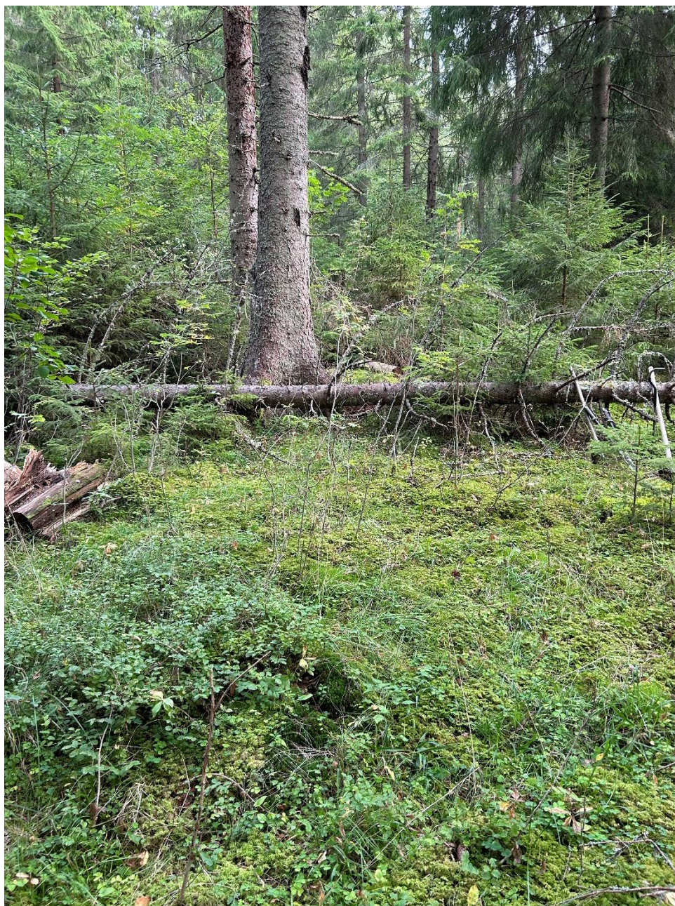
Figur 5. Exempel på svårframkomlig miljö inom utredningsområdet. Vid schakt 12.

Den arkeologiska utredningen genomfördes den 29–31 augusti 2023. Utredningen genomfördes under goda väderförhållanden. En starkt begränsande faktor utgjordes av ställvis mycket tät vegetation och kullfallna träd (se figur 5). Detta gällde framför allt den yta där ett torp legat enligt 1841 års karta, men till viss del även det norra området. En annan begränsande faktor var terrängen i delar av den norra ytan som var så pass brant på sina ställen att maskin med svårighet kunde ta sig fram.