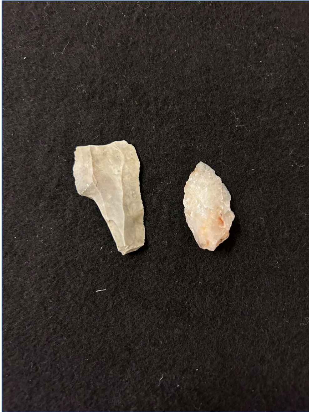
Figur 4. Fynd från L2006:6975. Till vänster är ett avbrutet spån av flinta. Till höger en pilspets av kvarts.