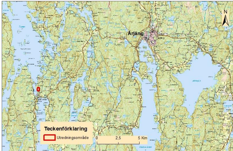
Figur 1. Utsnitt ur Terrängkartan som visar utredningsområdets belägenhet i landskapet.