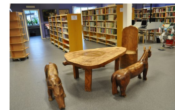
Möbelgrupp av skulptör Börje Wahlström

Om böckerna inte lämnas tillbaka efter påminnelse skickar biblioteket en räkning. Lämnas böckerna tillbaks omedelbart betalas endast övertidsavgift.