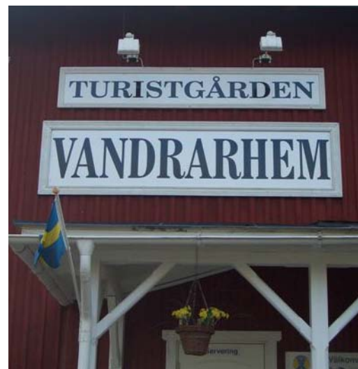
Skyltning på egen byggnad