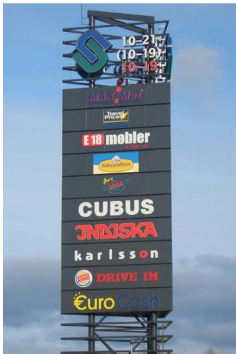
Samlad skyltning på mast